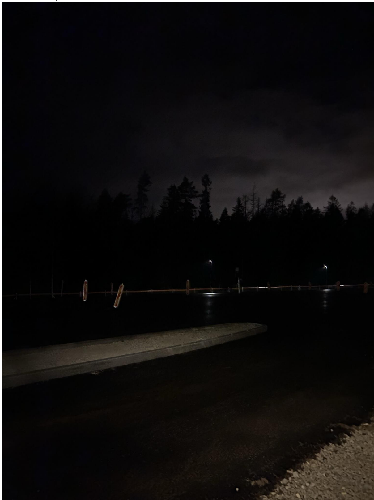
Foto nr 1: Pildistatud vasakpoolsest bussipeatusest parempoolset bussipeatust. Peatus asub üle 4 sõidurea pimedas.